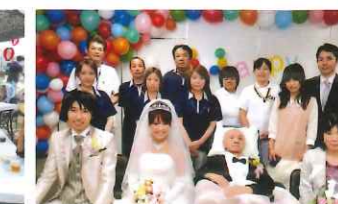
ウェディングドレス披露(夢プラン)