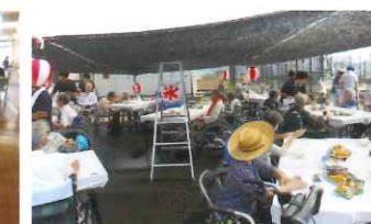
ロイヤルピアガーデン