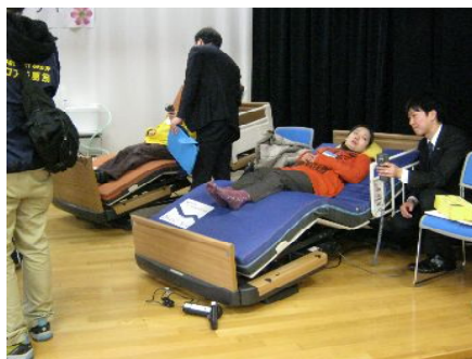
↑いろいろな福祉機器等を体験していただくことができました。