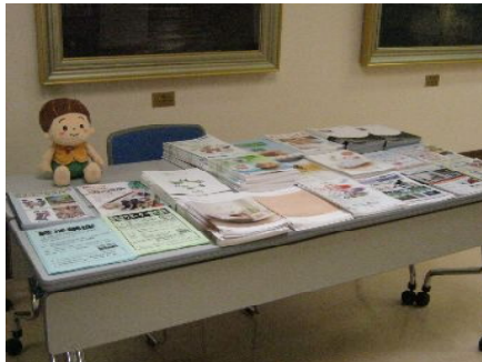
↑さまざまなパンフレット等を配布しました。