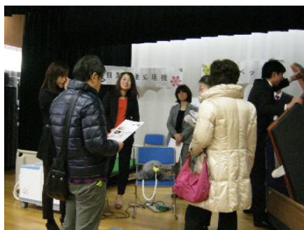
↑“パロ”の周りにはたくさんの人が集まりました。