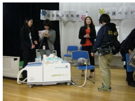
↑ケーブルテレビの取材も受けました。