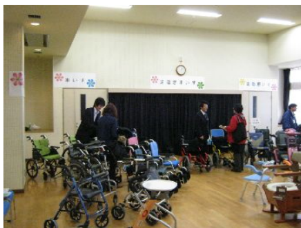
↑車いすや歩行器等をたくさん展示しました。

車いすや特殊寝台、手すり、歩行器、入浴補助用具等、さまざまな福祉機器をご覧いただき、実際に体験もしていただきました。