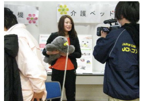
↑ケーブルテレビ“JCNコアラ葛飾”にて当日の様子が放映されました。