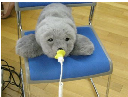
↑人気者の“パロ”です。

癒し系介護ロボット“パロ”は開催前から大人気で、当日もたくさんの方に“パロ”のブースに立ち寄りいただきました。