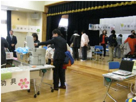
↑たくさんの方にお越しいただきました。

2014年1月22日(水)南綾瀬地区センターホールにて、福祉機器展～福祉機器を実際に見てみよう、さわってみよう!～を開催し、地域の方や介護保険事業関係者等、さまざまな方にご来場いただきました。当センター初の試みでしたが、大変好評でした。今後も継続して開催していきたいと考えております。2面に詳しい内容を掲載いたしましたので、ご興味を持たれた方は、次回開催時に、ぜひご参加いただきたいと思います。