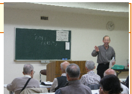
↑高齢者クラブ“四季の會”で開催した講座の様子です。

当センターに講師派遣のご依頼をいただく出前講座というかたちでの“認知症サポーター養成講座”も、今年はたくさん開催させていただいております。これまでも、高齢者クラブや薬局、企業等、いろいろな団体からご依頼をいただき、開催しています。今後も、地域の中に認知症について正しく理解した人を増やせるよう、活動を展開していきます。さまざまな団体等からの出前講座開催のご依頼も、お待ちしております!!