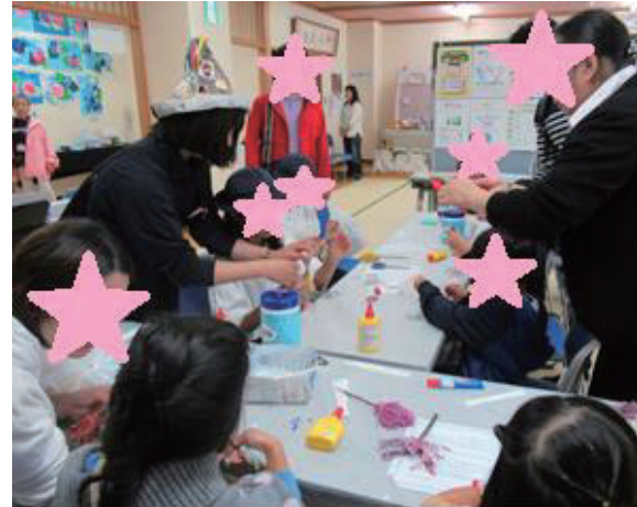
↑毛糸を束ねてほうきを作ります

他には、タブレット型の物忘れプログラムを実施して、もの忘れチェックに参加して頂きました。忘れっぽくなったな？と思ったら早めに相談しましょう。参加いただいた皆様からは、認知症予防への皆様の関心の高さがわかり非常に嬉しく思いました。