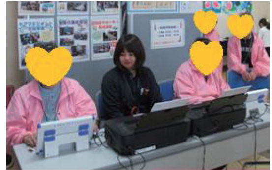
↑もの忘れチェックは、数分で簡単にチェックできます