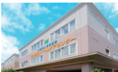
利府仙台ロイヤルケアセンター 丸森ロイヤルケアセンター